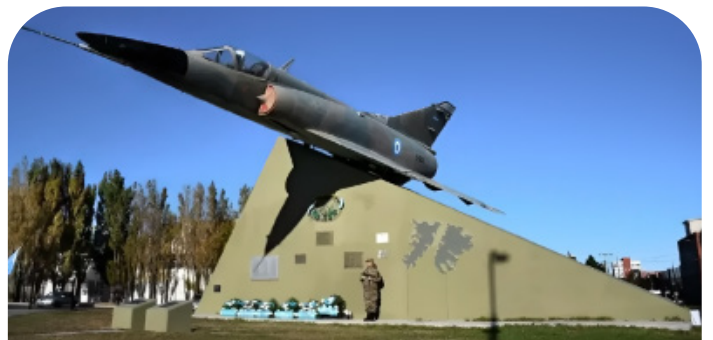
Monumento a los Pilotos Caídos en Combate, ubicado en Río Gallegos, Santa Cruz