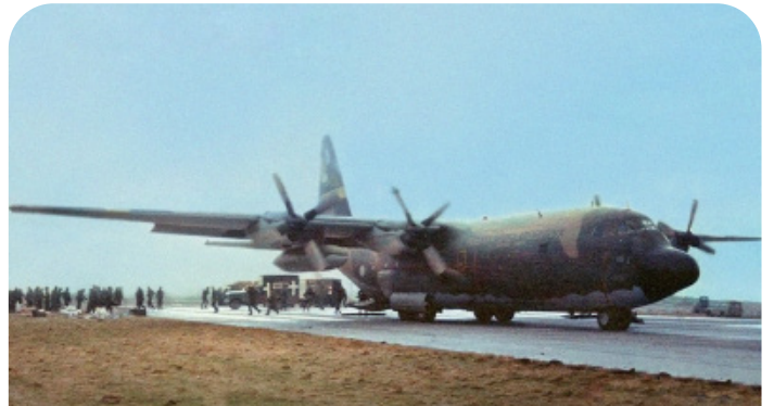
Aeronave Hércules C-130