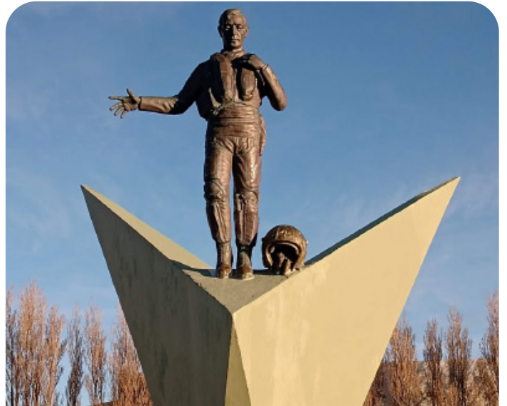
"Monumento a los pilotos de la Fuerza Aérea muertos en acción". Inaugurada el 19 de diciembre de 1983, en Río Gallegos, provincia de Santa Cruz.

Opinión del Almirante John Woodward, Comandante inglés de la Fuerza de Tareas: "Lo que pasó es que desconocía el potencial de la Fuerza Aérea Argentina; mejor dicho, jamás pensé que sus pilotos hicieran lo que hicieron. No fue un error mío; cualquiera en mi lugar habría actuado como yo."