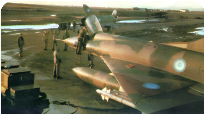
Avión de combate M-5 Dagger