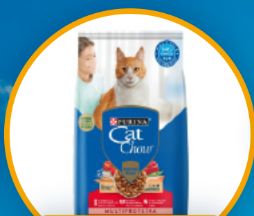
ALIMENTO PARA MASCOTAS