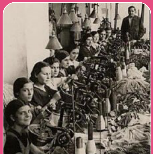
Fábrica textil a principios del Siglo XX

En 1977 la ONU declaró el 8 de marzo Día Internacional de la Mujer con el objetivo de reivindicar el trabajo por los derechos de las mujeres y promover su participación en los distintos ámbitos de la sociedad para su emancipación. La fecha conmemora a las 129 obreras textiles de la fábrica Cotton de Nueva York, Estados Unidos, que fallecieron en 1908 a consecuencia de un incendio mientras hacían huelga para mejorar sus condiciones laborales.