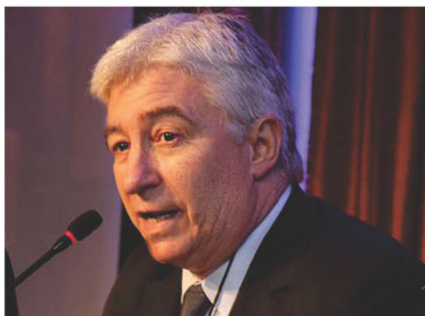
Presidente del INAES Dr. Marcelo Collomb

Se pusieron en marcha las jornadas de capacitación para Cooperativas y Mutuales para la realización de la Actualización de Datos, organizada por el Instituto Nacional de Asociativismo y Economía Social (I.N.A.E.S.). En la jornada inaugural que se llevo a cabo en la Ciudad de Rosario el Presidente del Instituto Dr. Marcelo Collomb destaco es su discurso inaugural "Este proceso que estamos realizando en conjunto con el Ministerio de Modernización, es de vital importancia para lograr un avance significativo en la cantidad y calidad de la información sobre las entidades de todo el país"