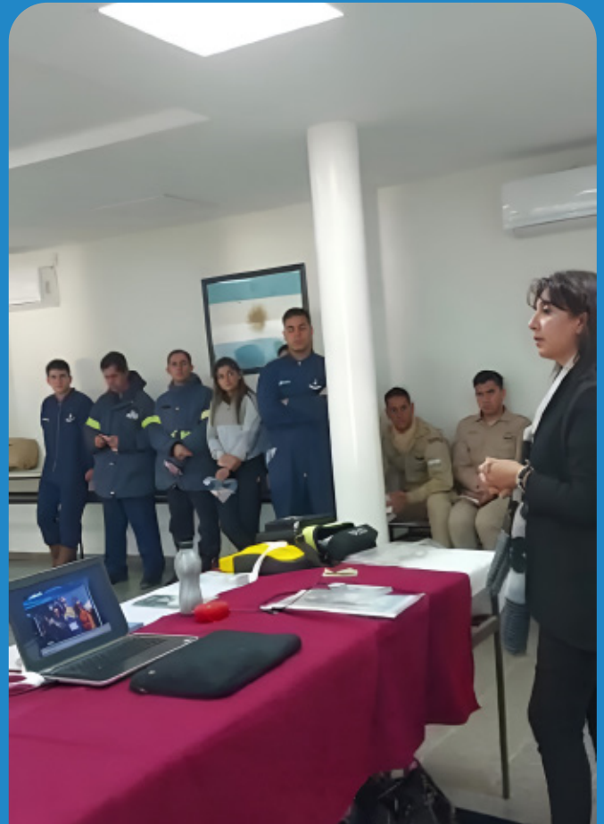
Reunión informativa en Prefectura.