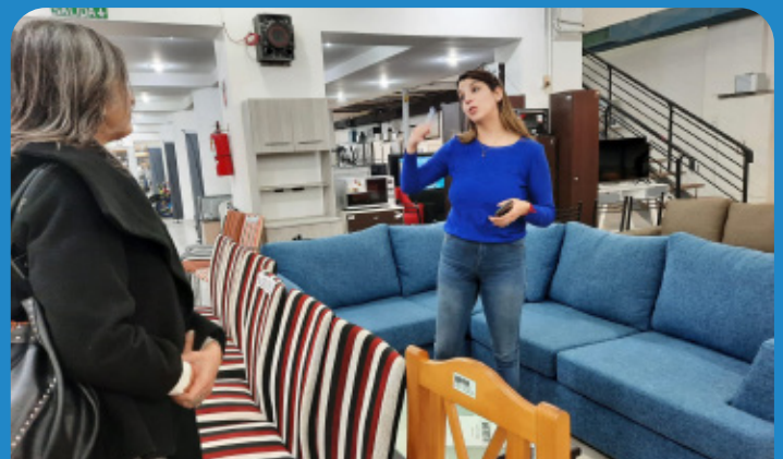
Gestionando convenios de comercio.