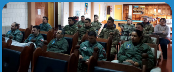
Reunión informativa en la X Brigada Aérea.