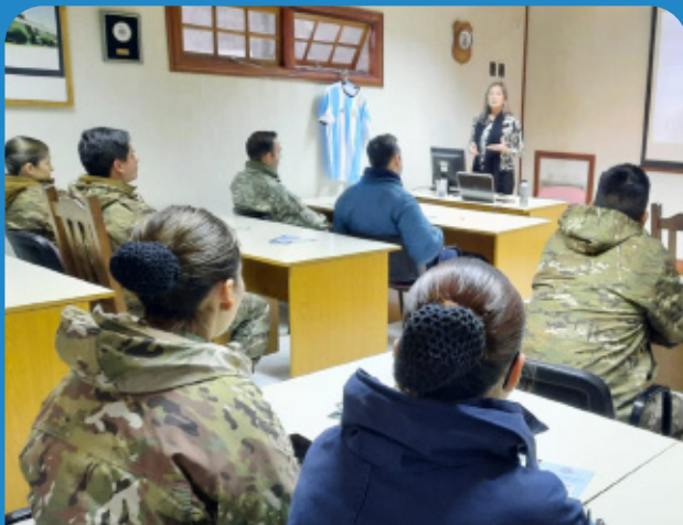
Reunión informativa en Grupo II Comunicaciones.