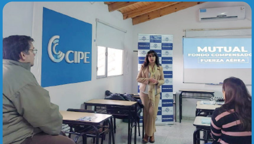
Asesorando a nuestros asociados.