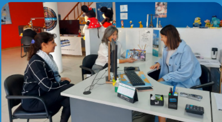
Gestionando convenios de turismo.