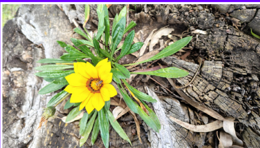
3° Puesto Moyano Paola - IOSFA