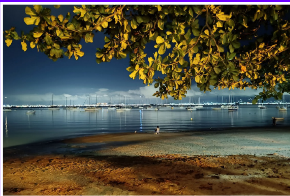
2° Puesto Villalva Cristina - Hospital Aeronáutico Central